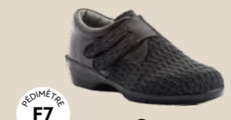
GALA • 35 au 42 DIABÈTE | HALLUX VALGUS HÉMIPLÉGIE | POLYARTHRITE