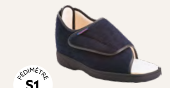
NEW SCORE • 35 au 48 DIABÈTE | HALLUX VALGUS HÉMIPLÉGIE | OEDÉMATIE POLYARTHRITE