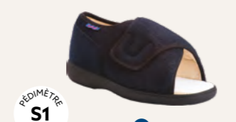
NEW REMEDIAL OUVERT 35 au 48 DIABÈTE | HALLUX VALGUS HÉMIPLÉGIE | OEDÉMATIE POLYARTHRITE