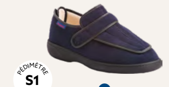
NEW RELAX • 35 au 48 DIABÈTE | HALLUX VALGUS HÉMIPLÉGIE | OEDÉMATIE POLYARTHRITE