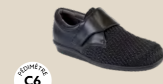
AD-2431 • 39 au 46 DIABÈTE | HALLUX VALGUS HÉMIPLÉGIE | POLYARTHRITE