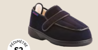
RELAX XTRA • 35 au 48 DIABÈTE | HALLUX VALGUS HÉMIPLÉGIE | OEDÉMATIE POLYARTHRITE