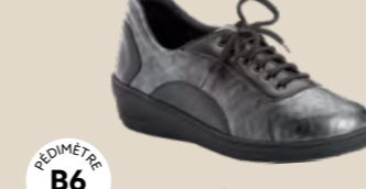
BR-3047 • 35 au 42 DIABÈTE | HALLUX VALGUS POLYARTHRITE