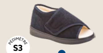
BR-3043 • 35 au 45 DIABÈTE | HALLUX VALGUS HÉMIPLÉGIE | OEDÉMATIE POLYARTHRITE