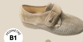
BR-3140 • 35 au 42 HALLUX VALGUS | POLYARTHRITE