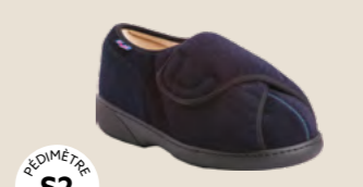
REMEDIAL XTRA FERMÉ • 35 au 48 DIABÈTE | HALLUX VALGUS HÉMIPLÉGIE | OEDÉMATIE POLYARTHRITE