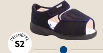
FUN XTRA • 35 au 48 DIABÈTE | HALLUX VALGUS HÉMIPLÉGIE | OEDÉMATIE POLYARTHRITE