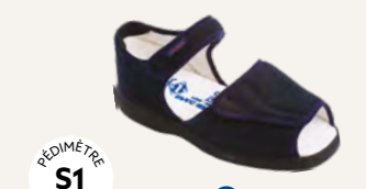
NEW FUN • 35 au 48 DIABÈTE | HALLUX VALGUS HÉMIPLÉGIE | OEDÉMATIE POLYARTHRITE