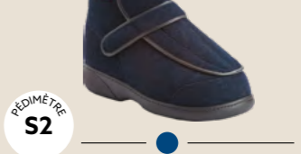
HARLEM XTRA • 35 au 48 DIABÈTE | HALLUX VALGUS HÉMIPLÉGIE | OEDÉMATIE POLYARTHRITE