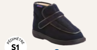
NEW HARLEM • 35 au 48 DIABÈTE | HALLUX VALGUS HÉMIPLÉGIE | OEDÉMATIE POLYARTHRITE