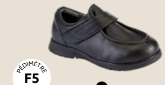
AD-2430 • 35 au 46 DIABÈTE | HALLUX VALGUS HÉMIPLÉGIE | OEDÉMATIE POLYARTHRITE