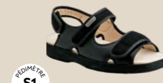
PU-1018 • 35 au 48 HALLUX VALGUS HÉMIPLÉGIE | OEDÉMATIE POLYARTHRITE