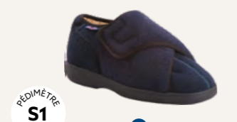
NEW REMEDIAL FERMÉ • 35 au 48 DIABÈTE | HALLUX VALGUS HÉMIPLÉGIE | OEDÉMATIE POLYARTHRITE