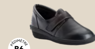
BR-3016 • 35 au 42 DIABÈTE | HALLUX VALGUS POLYARTHRITE