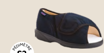
SAY XTRA • 35 au 48 DIABÈTE | HALLUX VALGUS HÉMIPLÉGIE | OEDÉMATIE POLYARTHRITE