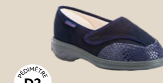
HEEL NATUREL • 35 au 42 DIABÈTE | HALLUX VALGUS HÉMIPLÉGIE | POLYARTHRITE