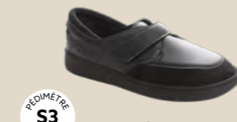
BR-3033-B • 35 au 48 DIABÈTE | HALLUX VALGUS HÉMIPLÉGIE | POLYARTHRITE