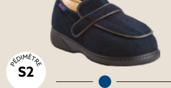
LEIDEN XTRA • 35 au 48 DIABÈTE | HALLUX VALGUS HÉMIPLÉGIE | OEDÉMATIE POLYARTHRITE