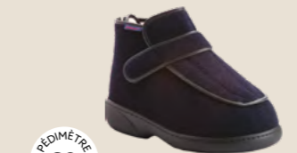
TIME XTRA • 35 au 48 DIABÈTE | HALLUX VALGUS HÉMIPLÉGIE | OEDÉMATIE POLYARTHRITE