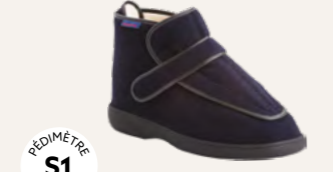
NEW TIME • 35 au 48 DIABÈTE | HALLUX VALGUS HÉMIPLÉGIE | OEDÉMATIE POLYARTHRITE