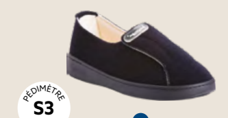
DIESE • 35 au 45 DIABÈTE | HALLUX VALGUS HÉMIPLÉGIE | OEDÉMATIE POLYARTHRITE