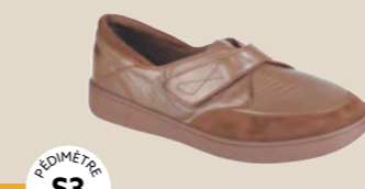
BR-3033 • 35 au 48 DIABÈTE | HALLUX VALGUS HÉMIPLÉGIE | POLYARTHRITE