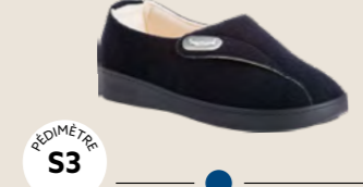
CHORUS • 35 au 42 DIABÈTE | HALLUX VALGUS HÉMIPLÉGIE | OEDÉMATIE POLYARTHRITE