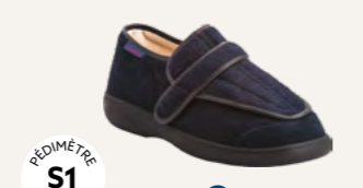
NEW LEIDEN • 35 au 48 DIABÈTE | HALLUX VALGUS HÉMIPLÉGIE | OEDÉMATIE POLYARTHRITE