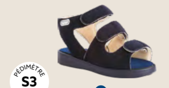
NICE • 35 au 45 HALLUX VALGUS HÉMIPLÉGIE | OEDÉMATIE POLYARTHRITE