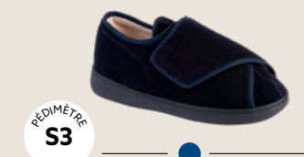
BR-3282 • 35 au 46 DIABÈTE | HALLUX VALGUS HÉMIPLÉGIE | OEDÉMATIE POLYARTHRITE