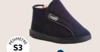
MIXT • 35 au 45 DIABÈTE | HALLUX VALGUS HÉMIPLÉGIE | OEDÉMATIE POLYARTHRITE