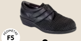
AD-2432 • 35 au 42 DIABÈTE | HALLUX VALGUS HÉMIPLÉGIE | OEDÉMATIE POLYARTHRITE