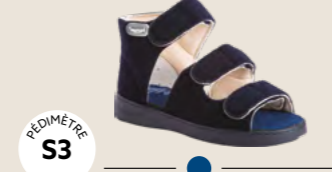
COOL • 35 au 45 DIABÈTE | HALLUX VALGUS HÉMIPLÉGIE | OEDÉMATIE POLYARTHRITE